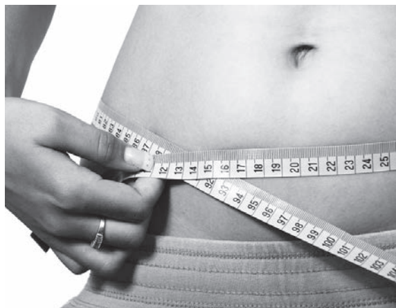
Figura 1. Medición de la cintura.

La medición hay que realizarla en la parte más voluminosa de su vientre con una cinta métrica. Esta medición se denomina “circunferencia de la cintura” (Figura 1).